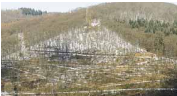
Die Wege des Weinberges im Winter