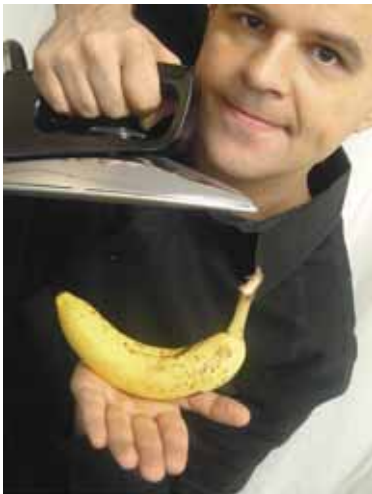
TOPAS – „Gerät außer Kontrolle“ – Comedy

36219 Cornberg • „Ferrari Küsschen“ Rasant wie ein Ferrari – süß wie ein Schoko- Küßchen – eine turbo-lente A-Capella-Show. Kloster Cornberg, Beginn: 20.00 Uhr. Vorverkauf: Kulturverein Kloster Cornberg, Am Markt 8, 36219 Cornberg, Telefon 0 56 50/96 97-15 Sparkasse Bad Hersfeld- Rotenburg