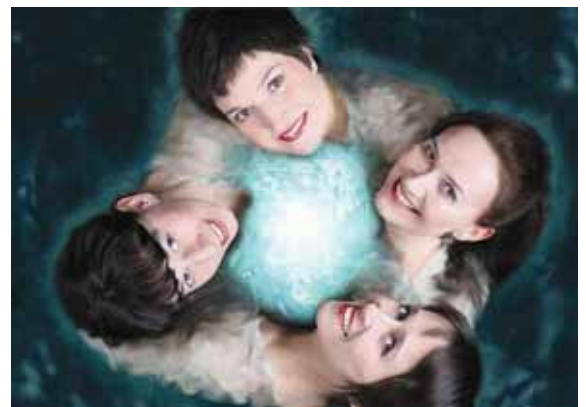
Aquabella, Weltmusik „Sonho meu – mein Traum“