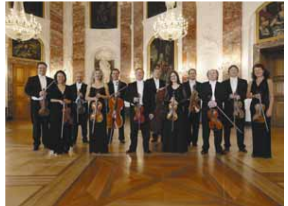
Kurpfälzisches Kammerorchester „Flautissimo – Berühmte Flötenkonzerte“