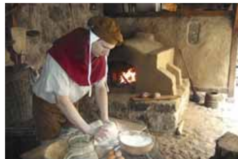
Backen im Lehmofen