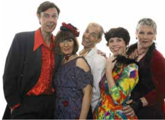
„Ferrari Küsschen“ Rasant wie ein Ferrari – süß wie ein Schoko-Küßchen

36381 Schlüchtern- Ramholz • TOPAS „Gerät außer Kontrolle“ Comedy. Schlosscafe Ramholz, Beginn: 20.00 Uhr. Vorverkauf: - Buchhandlung „Bücher und mehr“,