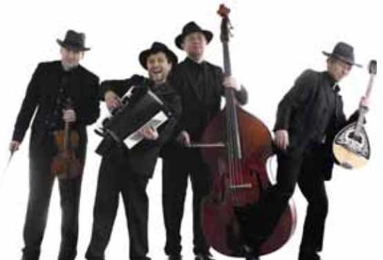
Das Blaue Einhorn

34131 Kassel- Wilhelmshöhe • Eröffnungsveranstaltung zum „Tag des offenen Denkmals“ 2011 in Hessen Musikalische Umrahmung: Slide Connection – Posaune pur. Ballhaus, Beginn: 16.00 Uhr, der Eintritt ist frei. Weitere Informationen im internet unter www.denkmalpflege- hessen.de • Ensemble „Les Coquetteries“ Barocke Koketterien, Werke für Traversflöte, Barock-Fagott und Cembalo. Ballhaus, Beginn: 19.00 Uhr.