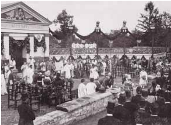
Rechts von oben nach unten:

Abb. 1: Kaiser Wilhelm II. während der Grundsteinlegung im Römerkastell Saalburg am 11. Oktober 1900.