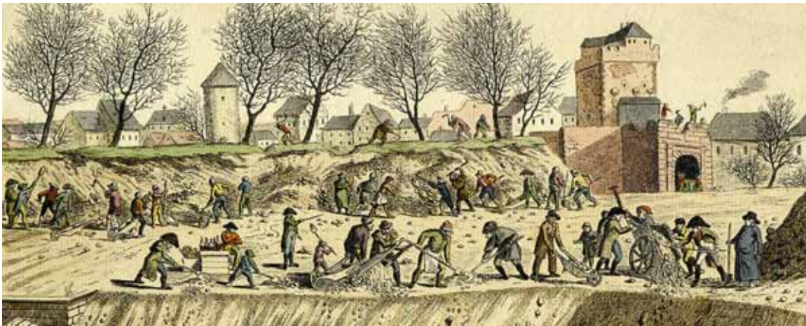
Befreiung von jahrhundertalten Fesseln: Johann Christian Berndt „Die Frankfurter Bürger beim Schleifen der Festungswälle“ 1805. In: Historische Ortsansichten, www.lagis-hessen.de

20. Jahrgang Herausgegeben vom Landesamt für Denkmalpflege Hessen Schloss Biebrich 65203 Wiesbaden www.denkmalpflege- hessen.de