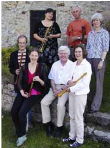
CONCERT ROYAL Köln

berg, Klosterhof 10, 37194 Wahlsburg, Telefon 05572/999226;